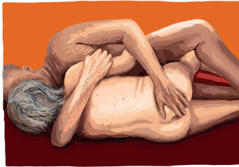
Sex haben – Liebe machen