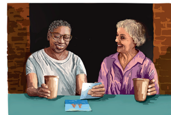
reden – lachen – kümmern