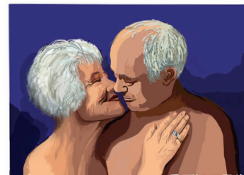
kuscheln – zärtlich sein